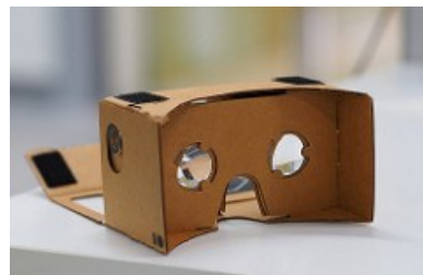
Google Cardboard

Y es que es precisamente el precio cada vez más asequible de las tecnologías que hacen posible la Realidad Aumentada y la Virtual lo que hace que su adopción esté progresivamente más generalizada en la educación superior. Algunos proyectos pilotos llevados a cabo hace algunos años ya pusieron de manifiesto los impactos positivos de estas tecnologías en el aula, incluyendo el impulso de las dinámicas de grupo y el aprendizaje entre iguales. La Realidad Aumentada puede también ayudar a los alumnos a aprender ubicando el contenido del curso en su contexto, es decir, en escenarios que reproducen situaciones del mundo real en los que pueden aplicarse los nuevos conocimientos adquiridos.