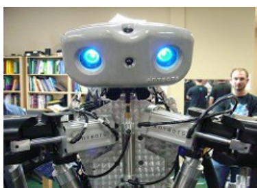
Hello, I'm a Robot.

Aunque el impacto de la Robótica en la educación superior no está previsto hasta dentro de cuatro o cinco años, el uso de estas máquinas ya está muy extendido en el ámbito de la Medicina. Además, muchas instituciones universitarias están promoviendo la Robótica y la Programación como habilidades STEM multidisciplinares que hacen que los alumnos resuelvan con más facilidad los problemas. Algunos estudios afirman, además, que la interacción con robots humanoides puede ayudar a los estudiantes con trastornos del espectro autista a desarrollar mejor sus estrategias de comunicación y sus habilidades sociales.