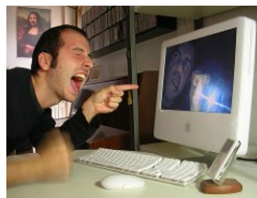
Look too damn happy

Aunque se han hecho muchos progresos en el ámbito de la Computación Afectiva, tendremos que esperar bastante tiempo para asistir a la generalización de esta tecnología. No obstante, algunos investigadores están empezando a poner en práctica sus estudios directamente en la enseñanza y el aprendizaje en educación superior. En Grecia, el Laboratorio de Redes Informáticas y de Aplicaciones Telemáticas de la Universidad de Macedonia, reconoce que los docentes eficientes tienen, por regla general, la capacidad de reaccionar de manera intuitiva a las emociones de los estudiantes, como el aburrimiento o la preocupación, pero esta habilidad no ha sido trasladada aún a los entornos de aprendizaje en línea. Eso sí, investigadores de la Universidad de Stanford, en California, Estados Unidos, han creado YouED , una herramienta que detecta y gestiona de manera automática posibles confusiones en entradas en foros y envía breves clips de vídeo como respuesta a los estudiantes.